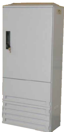
Dimensions armoire de commande (mm)